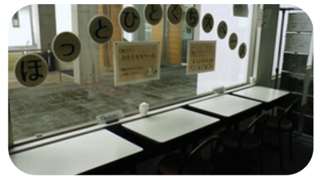
ほっとひとくちスペース (1階)