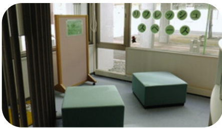
リフレッシュスペース (1階)

リフレッシュスペースが1階と2階に、ほっとひとくちスペースが1階に誕生！ ちょっと休憩したいとき、気分転換したいときにどうぞ♪