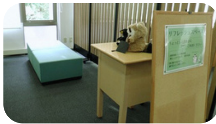
リフレッシュスペース (2階)