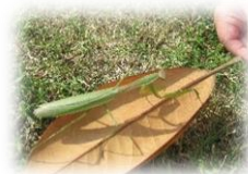
カマキリ見つけたよ！