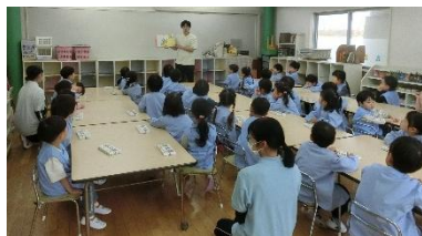
実習生と絵画活動

12月 5日 半日保育 ホッズ△ 6日 生活発表会 8日 代休 9～11日 チャレンジ参観 12日 餅つき 19日 2学期終業式 22・23日 希望個人懇談 26日 ホッズ△ 27日～ 休業