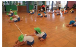
B組さん フープで二人組