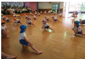
A組さん 表現体操 春をテーマに...