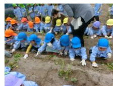
さつまいもの苗植え