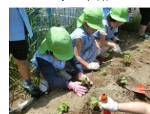
トマト・なす・きゅうりの苗植えと水やり