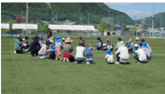
親子交流会 楽しかったね!

雨の音を聞き、雨の強さや量を感じる。雷の音を聞いて、稲光を見て、雷の位置や強さを感じる。風の音を聞いて、風にあたってみて、風の向きや強さを感じる。大雨、雷、強風の時、怖いだけの体験に終わらせず、次につながる体験にしていきたいと思います。いざという時に命を守る感性を豊かにする経験にしていきたいと思います。