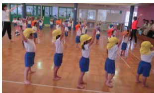
北富先生の体操の日 C組さん