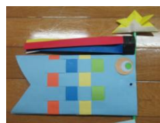
A 編み込む 貼る