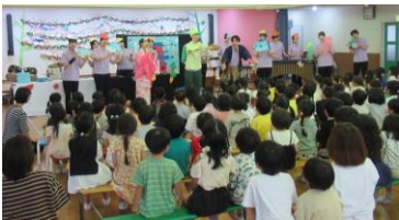
大学の音楽ゼミ生による演奏 素敵演奏！