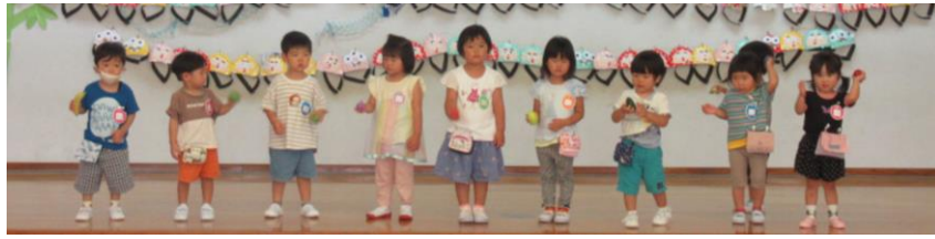
D組 ころころフレンズ