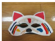
A 狐 B うさぎ C ひよっこ D おばけ