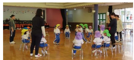
実習生と体操ゲーム