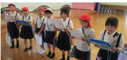
可部南小学校2年生の訪問