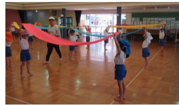
A組 パラウェーブ体操