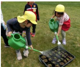
A フラワーフェスティバルのために、ペチュニアの苗を育てています。トマトの「りりこ」を植え付けました。