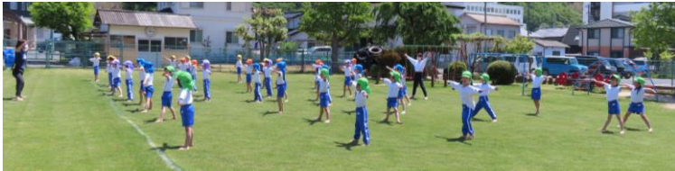
今年度の準備体操は『グッドラック体操』Sixtones です。全園児が体操します。

連休が明けましたら、これまでの育ちをもとにして、さまざまな体験をしながら、多方面にさらなる一歩を踏み出していきます。