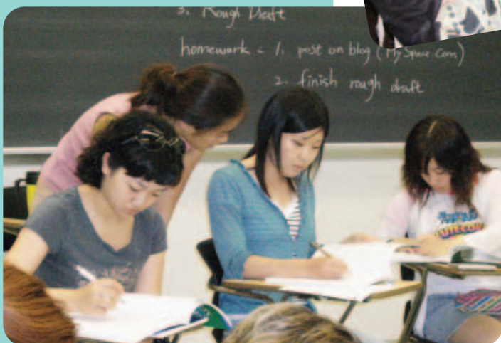
英語にもすっかりなれて、授業もどんどんすすみます!