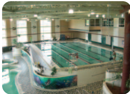
豪華なプールで身も心もリフレッシュ!