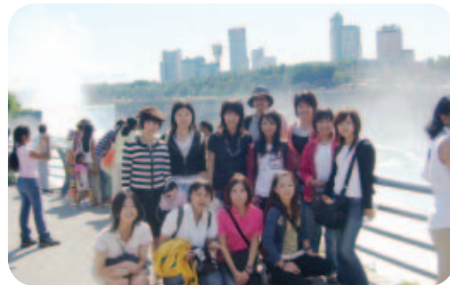
週末には、ナイアガラの滝まで小旅行。日本ではまず見られない雄大な景色にみんな感動!