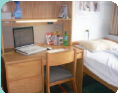
寮は二人で一部屋、清潔で快適です。