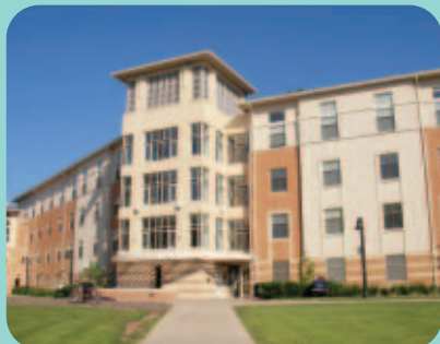
学生寮外観。オートロックのセキュリティは万全です。キッチン、自動洗濯機も完備しているので、生活面での心配はいりません。