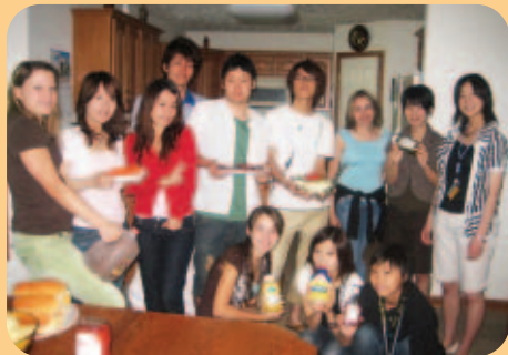
先生のお宅におじゃまして、ホームパーティー。