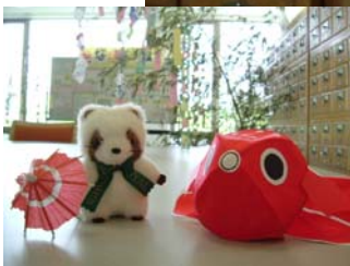
← 山口の"金魚ねぶた"