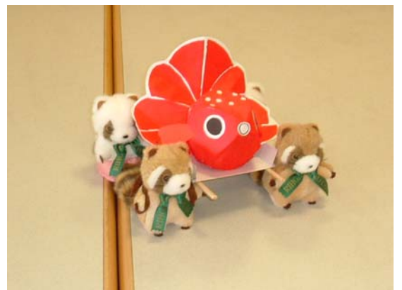
金魚ねぶたを担いでいる 様子の再現 →