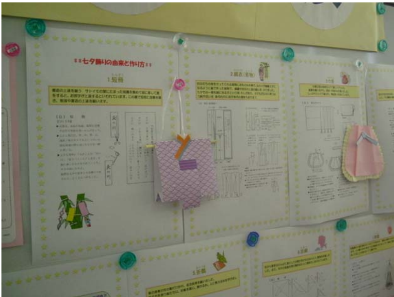
← 笹に飾る七夕飾りには、 一つずつ意味があります！ それを紹介！