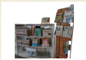
就職関連資料コーナー