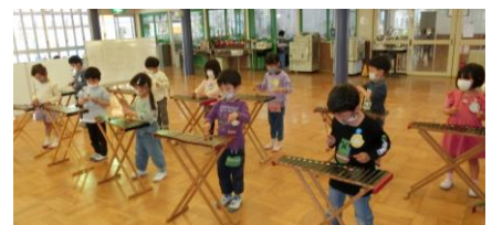
A: 木琴 楽譜の紹介