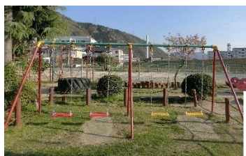
大人気のブランコ 鎖と座板を安全なもの に取り替えました。