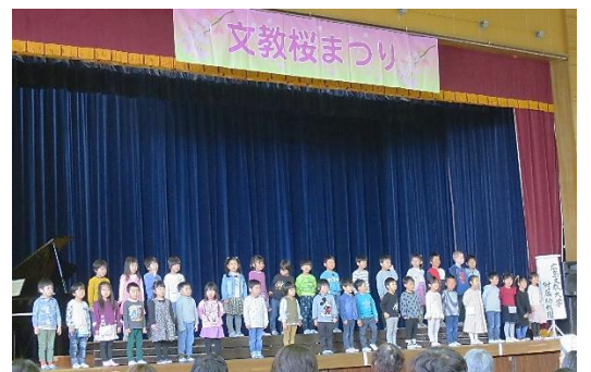
附属高校の桜祭りに参加(A組) ♪ はるがくる たのしい幼稚園 小さな世界 はるがきた