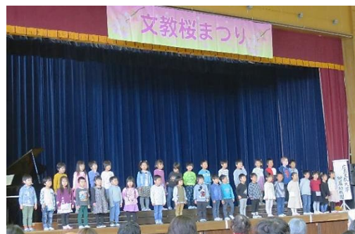
4月3日 附属高校の桜祭りに参加(A組)