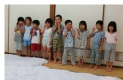
パジャマでポーズ！