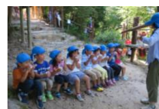
水分をとって・・・